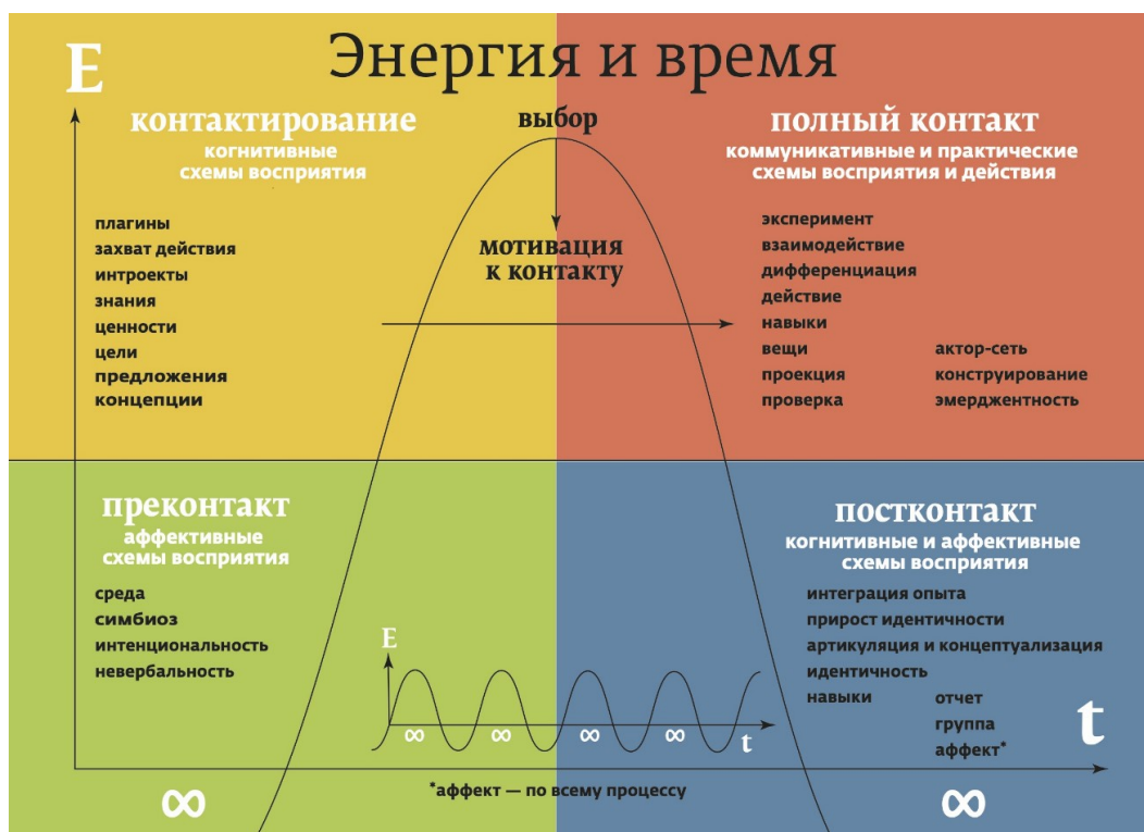
Рисунок 1. Концептуальная модель коммуникации

Рассмотрим этапы коммуникации, показывающей процесс становления, по схеме, представленной на рисунке 1.